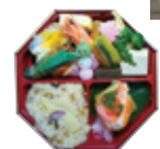
昼食は清閑亭でお弁当