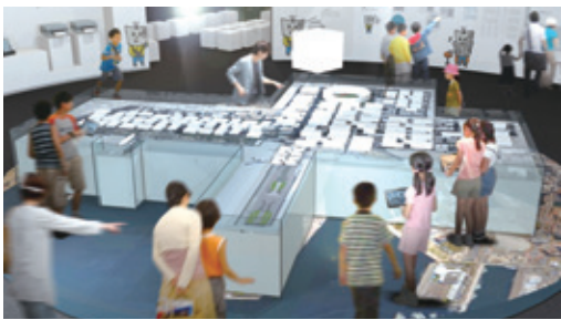
取材体験ゲーム「横浜タイムトラベル」

日刊新聞が生まれた横浜市中区日本大通のニューパーク(日本新聞博物館)が、7月20日(水)にリニューアルオープンした。横浜の街並みを再現したジオラマにタブレットをかざすと、過去へとタイムスリップ。記者になって横浜の歴史にまつわる謎を取材できる取材体験ゲーム「横浜タイムトラベル」が登場!オリジナル新聞づくりが体験できるなど、新聞やジャーナリズムの役割を楽しく学ぶ仕掛けがたくさん用意されている。