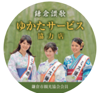
このステッカーが目印

◆問合せ ☎0467(23)3050 (8時30分～17時15分) 鎌倉市観光協会 ◆ 鎌倉市観光協会 検索