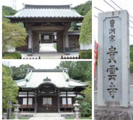
貴雲寺 (横浜市港北区岸根町614)

前回まで観音霊場を紹介してきたが、今回から薬師如来を信仰対象とする霊場をみていく。薬師如来は、その名称や左手に持つ薬壺などからうかがわれるように、一切の病氣、なかでも眼病に利益があるとされている。観音霊場が33カ所であるように、薬師霊場は薬師如来の十二大願や守護する十二神將の存在から、12あるいはその倍数である24カ所の札所から構成されることが多かった。また、ご開帳は十二支の寅年に実施されることが多い。