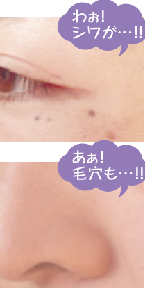
わお! シワが...!! ああ! 毛穴も...!!