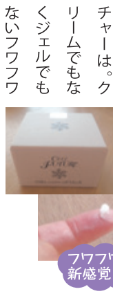
フワフワの新感覚!

後日ついに手元に、開けてみると...?なんだこの軽〜いテクスチャーは。クリームでもなくジェルでもないフワフワ