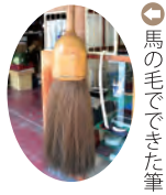
馬の毛でできた筆