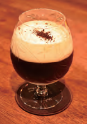
自家製コーヒーウォッカを用いたカクテル KODAMADO1,100円

北アルプスをもガイドする山男であった。「山が好きだからと、近くのバーの先輩が店名を付けてくれたんです。薬屋っぽいところも気に入ってます」。山男とバー、なんとなく腑に落ちてハマの夜が過ぎていった。