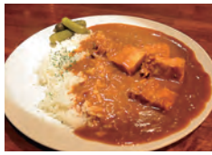
二十歳の頃、旅したインド&ネパール仕込み。スパイスから調合したポークカレー1,100円

◆中区太田町2-27 飛高ビル1F ◆喫茶11時~18時/Bar18時~翌5時 (L.O.4時30分) 日祝休 ◆☎045(641)0669