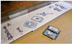
武者小路実篤による書。硯を持参して描いてもらった