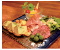
マッシュルームペーストのブルスケッタ等のオードブル盛合わせ1,500円