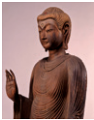
重要文化財 釈迦如来立像(極楽寺所蔵)

来る平成29年は、真言律宗を広め各地の社寺復興に携わった忍性の生誕800年、さらに真言律宗の鎌倉地方の拠点寺院「極楽寺」(称名寺)が西大寺の末寺となって750年の節目の年。忍性の関東布教や鎌倉幕府との関わりを中心にその足跡をたどる特別展。貴重な文化財が一堂に会す。