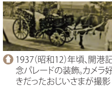
1 1937(昭和12)年頃、開港記念パレードの装飾。カメラ好きだったおじいさまが撮影