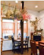
1 店内併設の「HAHA CAFE」