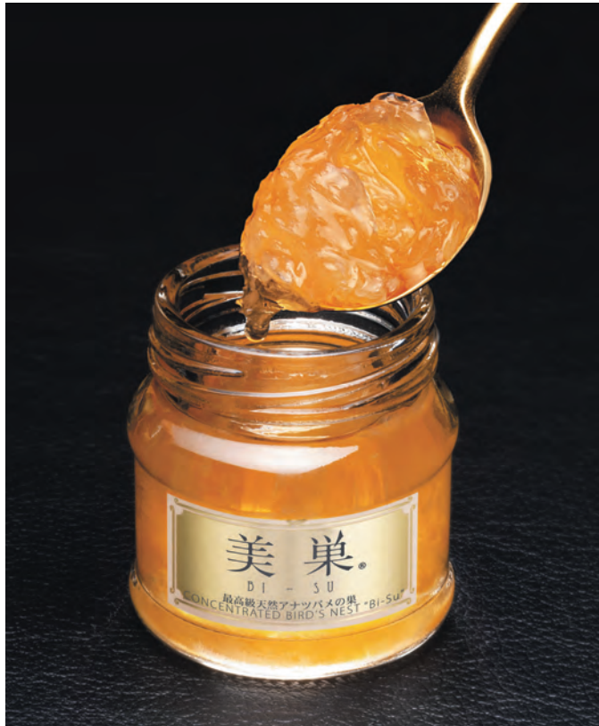
※写真は美巣16(食べるタイプ)です。17,500円(5個入り・税別)

楊貴妃をはじめ、アジアのセレブリティが美容と健康のために食してきた「ツバメの巣」。この秘宝的な高級食材をまるごと使った日本ブランドの美容ジュレが話題を集めている。本場、香港のマダムたちも箱買いするほどの人気で、食べる、肌にも体にも驚くほどの変化が現われるのか…。