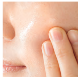
「美巣」の中で、最も重要な成分が「シアル酸」。女性が美肌と健康を保つ上で欠かせない今、注目されている成分だ。

悩みのタネだった目元のたるみや小じわも普段ほど気にならず、スキップしたくなるような体の軽さがず〜と持続。食品だか