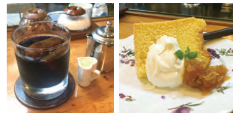
賢沢ダッチアイスコーヒー 手作りシフォンケーキ(400円)には生クリームと自家製ジャムが添えられる