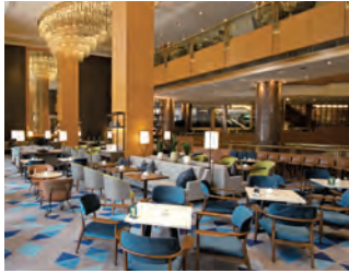
落ち着いた雰囲気の中、一人でも寛げる2Fシーウインド