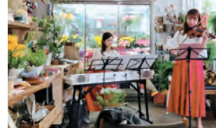
1 月に1回ほどコンサートを開催。フェイスブックで告知する

元町から山手へ上がる代官坂に佇む宮崎生花店。創業は横浜開港から14年後の1873(明治6)年。当時、関内内は商社が集まり山手は外国人居留地で、通勤路として人通りも多かった代官坂。初代は、造園業が盛んだった東京の梅屋敷から出て来てここで外国人のための洋花店を開き、店は代々引き継がれてきた。結婚式のためのブーケ作りをはじめ港に着く船の装飾や、夫から妻へ贈られる花のお届け、また街中をあげて祝ったという開港記念日の山車の花飾り。戦後はクリフサイド(ダンスホール)のお客さんへも花を届けた。