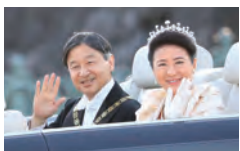
2019年11月10日読売新聞

新元号「令和」への改元、新天皇陛下の即位と、新たな時代が幕を開けた2019年を報道写真で振り返る。ラグビーワールドカップ(W杯)日本大会での日本代表の快進撃、揺れる香港など、国内外にわたる幅広いジャンルの報道写真の中から、厳選した約300点を展示。