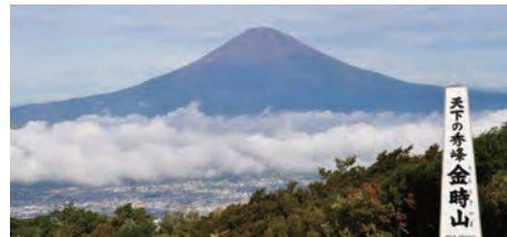
金時山山頂からの眺めは絶景

草原の山焼きが行われる。実施は当日の天候次第だが、この時期しか見られない雄大な風景は圧巻だ(予定日3月10日。予備日5日間あり)。