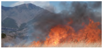
春を告げるすずき草原の山焼き

草原の山焼きが行われる。実施は当日の天候次第だが、この時期しか見られない雄大な風景は圧巻だ(予定日3月10日。予備日5日間あり)。