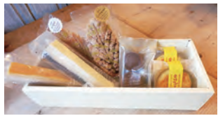
ラッキイズ・カフェ「焼き菓子詰め合わせ」1,212円