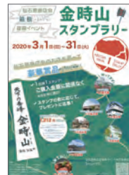
スタンプラリー台紙には各店の逸品や仙石原の観光情報が満載

参加店は主催の仙石原商店会、仙石原飲食店組合、金時飲食店組合の50店舗以上。参加店で購入または食事をすると、 金額に関係なくスタンプが1個押印され、スタンプを3個集めると抽選に応募できる。 5個、7個とスタンプが増えるごとに、応募できる賞品がランクアップ!