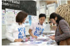
ヨコハマトリエンナーレ2017サポーター活動風景

7月から横浜美術館等で開催される「ヨコハマトリエンナーレ2020」で、会場の案内や作品メンテナンスのサポート、体験型の作品鑑賞の補助など、展覧会の運営に協力するホスピタリティサポーターを募集。事前に研修もある。興味のある方は専用フォームから申込みを。