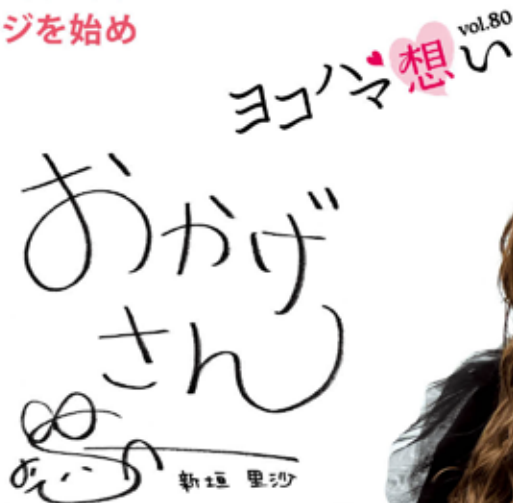
女優・歌手 新垣里沙さん niigaki risa

昨年10月からはAuDee(オーディー)という音声配信サービスで30分の番組が始まりました。今は直接ファンの方と交流する機会が少ないので、お題を出して回答を募集したり、皆さんの悩みに答えたりと、リスナーと双方向の番組づくりを心掛けています。2月には、梅棒というダンスエンターテインメント集団の舞台に出演します。セリフではなく、全てJ-POPの歌詞とダンスでストーリーを作っていく舞台で、観客として観に行き、ぜひ出演したいと願っていました。楽しい舞台なので、