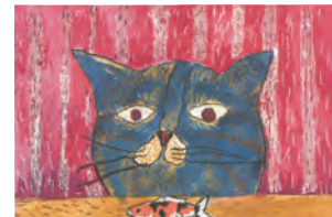
金賞受賞作「おながすいた」 ソニネットワオラゴン コラティット(タイ・男・10歳)