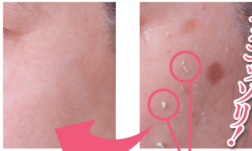
ポロポロと汚れた角質がとれます!