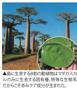
▲島に生息する8割の動植物はマダガスカルのみで生息する固有種。特殊な生態系だから赤みケア成分が生まれた。

その秘密はインド洋西部の秘境と呼ばれるマダガスカル島で見つかった。独自の生態系を有するマダガスカル島は2000年から10年間で約600種もの新種が発見されるなど近年、研究が進んでいるが、その中で