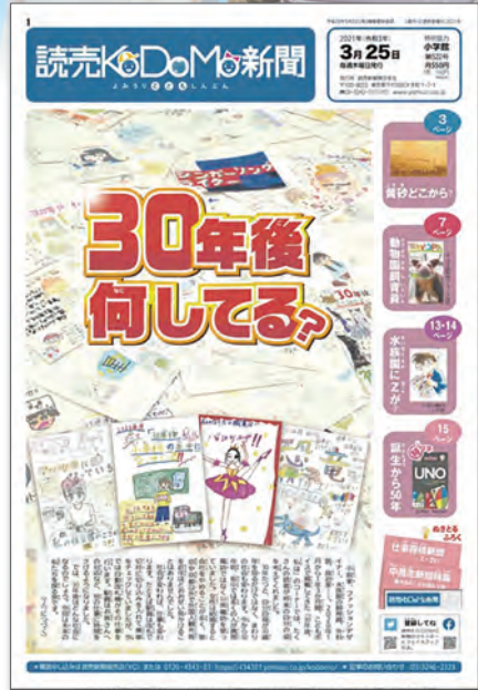
※紙面は2021年3月25日号です