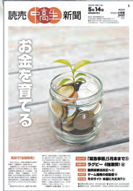
※紙面は2021年5月14日号です