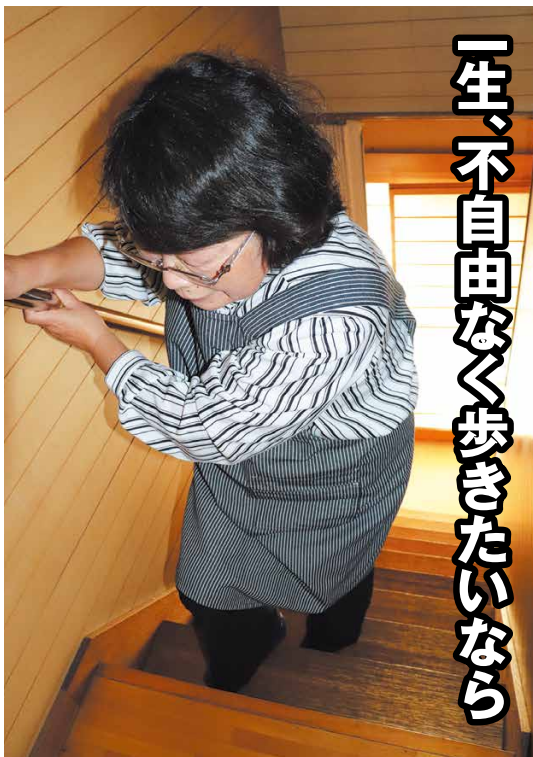
歩行能力が低下するにつれ生活に支障が生じてくる