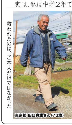
救われたのは、ご本人だけではありません

60代半ばで突然、両ひざともおかしくなり、つらいのを我慢しながら足を引きずって歩いていました。先生曰く、過去にひざを酷使した後遺症とのことでした。