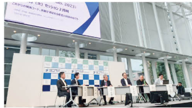
昨年開催された「ヨコラボ2023」のセッションの様子。活発な意見が交わされた。

3日目は横浜版地域循環型経済(サーキュラーエコノミーplus)の実践から生まれた食材に焦点をあて、取り組みの意義や食材の背景を発信。最終日は年齢や性別、国籍、障害の有無にかかわらず参加できるeスポーツの可能性を追求する。株式会社