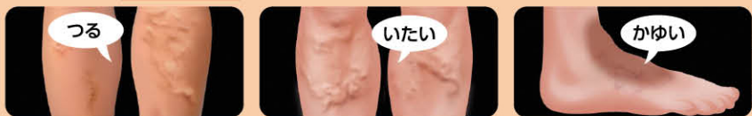
※イラストは 下肢静脈瘤 が悪化した状態 のCGです

上記の症状がある方は下肢の血管状態の悪化、もしくは下肢静脈瘤の可能性が ありますので、 静脈瘤検査 を受けられることをおすすめします。