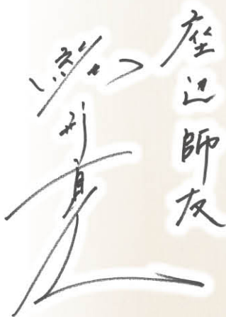
俳優 緒形直人さん Ogata Naoto

1967年横浜生まれ。88年、映画『優駿 ORACION』で俳優デビュー、第11回日本アカデミー賞新人賞など数々の賞を受賞、その後多くの作品に出演し活躍を続ける。近年は映画『64-ロクコン-後編』(2016年)、テレビドラマ『六本木クラス』(22年・テレビ朝日系)『アンチヒーロー』(24年・TBS系)などに出演。父・緒形拳、妻・仙道敦子、長男・緒形敦、次男・緒形龍はいずれも俳優。