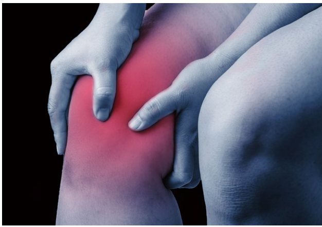
手の施しようがなくなる前に真実を知って欲しい