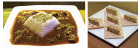
コンソメ&オリブオイルで炊いたライス おつまみにぴったり。もおいしい。BARの牛すじカレー1,000円 無花果バター600円

お酒を飲むための料理も充実している。鳥居さんおすすめのバー飯は、「BARの牛すじカレー」。とろりとした牛すじの旨味とス