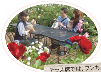
テラス席では、ワンちゃんと一緒に食事もしめる。