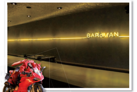
▲カウンターとバックバーのない壁面