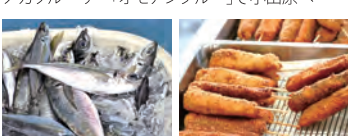
現地で鮮魚発送サービス有