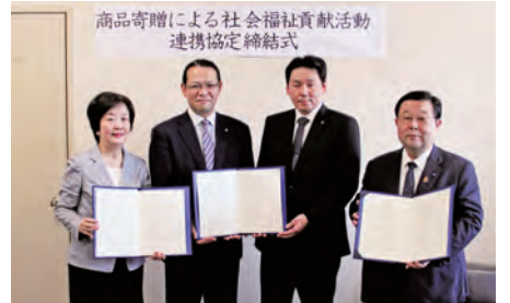
協定締結式に臨んだセブン-イレブンのマネジャー2人(中央)を囲んで、左が市社会福祉協議会常務理事、右が市健康福祉局長

横浜市のような大都市の中で、民間企業だけでは支援を必要とする一人一人の手に支援の品を直接届けることは難しい。そこで、地域とつながりの深い横浜市社会福祉協議会が商品の寄贈を受け、横浜市と協力しながら、高齢者や障がい者の施設、地域活動団体などへ配分先を調整して届ける計画だ。このような商品寄贈を地方公共団体と連携するのはセブン-イレブンにとって初めての事例とのこと。