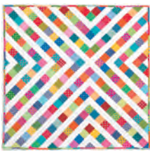
キルト時間7号掲載 作品:Modern Quilt Studio(U.S.A)