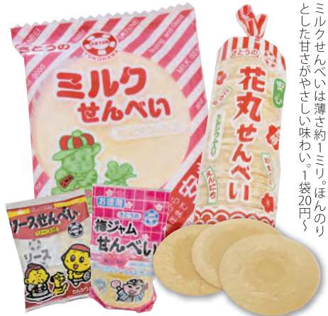
ミルクせんべいは薄さ約1ミリ。ほんのりとした甘さがやさしい味わい。1袋20円

の「このおせんべい、おいしいわね。ミルク入り?」の言葉に「そうだ!本当にミルクを入れたら、おいしくて子どものためになり喜ばれるの