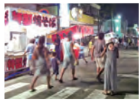
駄菓子といえは縁日

夢のような楽しい子ども時代を思い出す駄菓子。そのルーツは江戸時代までさかのぼる。当時白砂糖は貴重品、江戸庶民は黒砂糖で作られた雑菓子を食べていた。いつしか、この雑菓子を「駄菓子」と呼ぶように。昭和になると駄菓子屋の台頭、紙芝居屋の登場、縁日の屋台…と駄菓子の活躍の場は広がっていった。