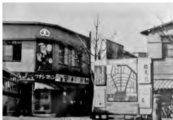
日吉町にあったツナシマパン店舗