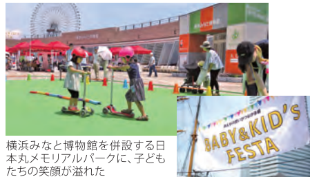
横浜みなと博物館を併設する日本丸メモリアルパークに、子どもたちの笑顔が溢れた

て、その場を訪れるきっかけが生まれ、活用の仕方でもこんなに楽しい場になるんだという気づきにつながれば」と語る。公共空間のモデル事業は、平成31年3月まで順次実施され、各企業は1年間の期限付きで継続開催が可能だ。10月には、週末限定・予約制のキャンピングオフィスを臨港パークで開催予定。新しいアウトドアワークスタイルを体験できる。「検証を積み重ね、より良い仕組みを構築していきたい」と河野さん。