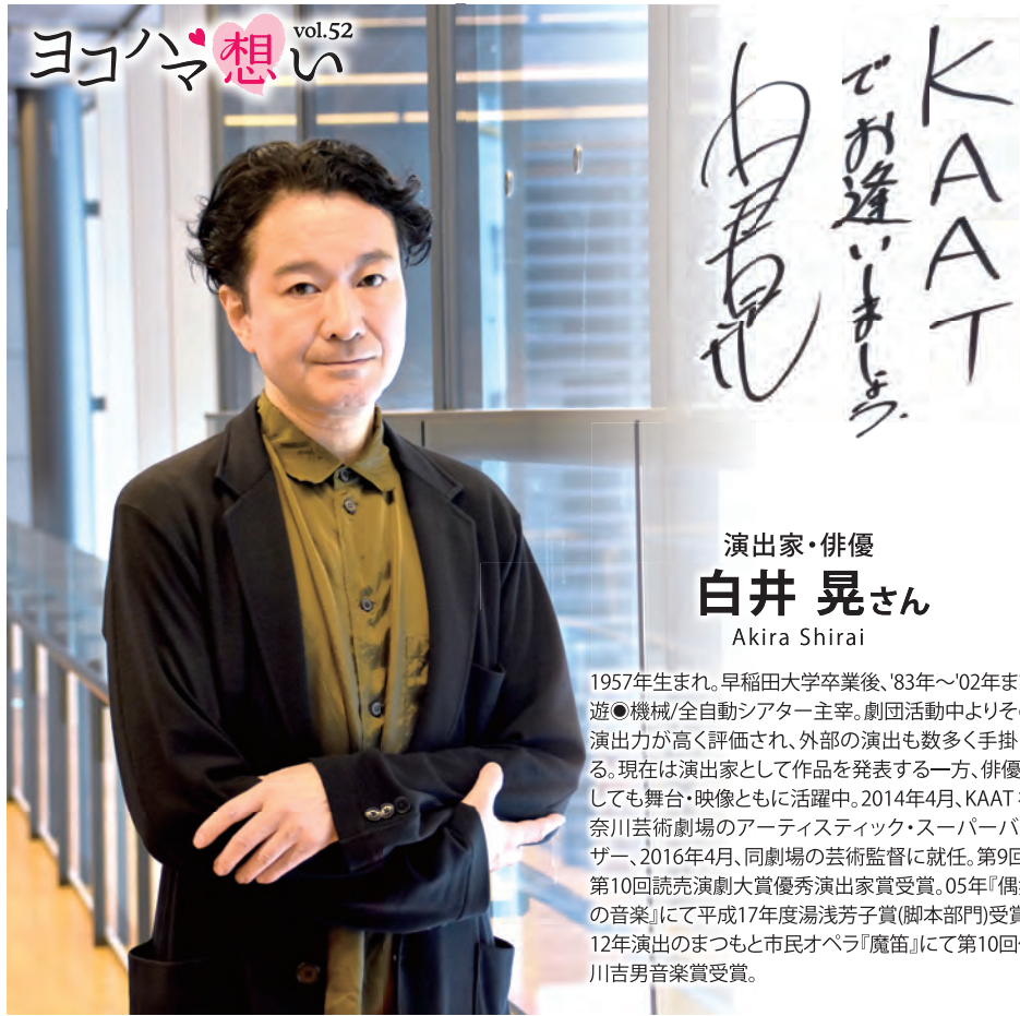
演出家・俳優 白井 晃さん Akira Shirai

1957年生まれ。早稲田大学卒業後、'83年〜'02年まで遊●機械/全自動シアター主宰。劇団活動中よりその演出力が高く評価され、外部の演出も数多く手掛ける。現在は演出家として作品を発表する一方、俳優としても舞台・映像ともに活躍中。2014年4月、KAAT 神奈川芸術劇場のアーティストック・スーパーバイザー、2016年4月、同劇場の芸術監督に就任。第9回、第10回読売演劇大賞優秀演出家賞受賞。05年『偶然の音楽』にて平成17年度湯浅芳子賞(脚本部門)受賞。12年演出のまつもと市民オペラ『魔笛』にて第10回佐川吉男音楽賞受賞。