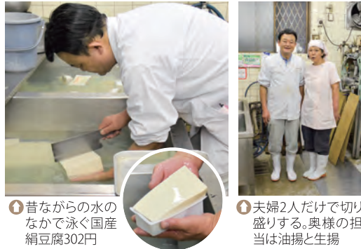
①昔ながらの水のなかで泳ぐ国産絹豆腐302円