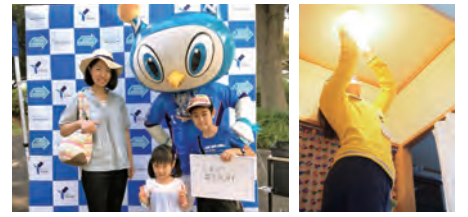
横浜FCのエコイベントでチームマスコットと記念撮影(左) イケアスタッフによるLED電球への交換作業(右)

また、IKEA港北との連携により、市営住宅の高齢者世帯で、白熱電球をLED電球へ交換する取り組みも継続して行っている。高所での電球交換が困難な高齢者世帯では、電球寿命が長いLEDは、交換回数も交換時の