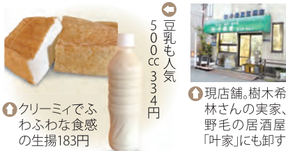
④クリーミーでふわふわな食感の生揚げ183円