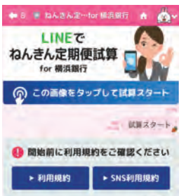
アプリ画面イメージ

◆問合せ ☎0120(188)824 横浜銀行コンタクトセンター ハローサービス(受付時間平日、土日9時~17時)