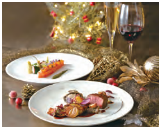
人気のフレンチ「ベイ・ビュー」では12月21日よりクリスマスメニューを提供

今年で20周年を迎えた横浜ベイシェラトン ホテル&タワーズでは、11月15日からひと足早くロビーのイルミネーションが点灯し、クリスマスを演出。全館で徐々にクリスマススペシャルメニューを提供し始める。また事前予約などで“シェラトンからの贈り物”としてさまざまな特典が用意されている。