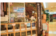
▲店頭では焼き立ての豆を販売。豆を求めるお客様が絶えない

モネのコーヒーに魅せられた人や、ふらっと気を休めに来た人のために、今日も心を込めて1杯を淹れる。