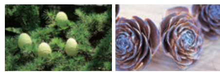
きれいな黄緑色の球果 先端がバラのように