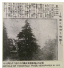
1912年「横浜貿易新報」の記事

日本初の西洋式公園である山手公園にもテニスコートを囲むように種が植えられ、大正から昭和の初め頃には、横浜のあちこちで横に張り出した大きな枝が風に揺れていた。しかし昭和40(1965)年頃から、大きすぎるとい理由で伐採が進んでしまう。山手公園のヒマラヤスギもその影響を受けて枝を落とされる、台風などの影響で倒れるなどの被害を受け、現在では直径1メートル