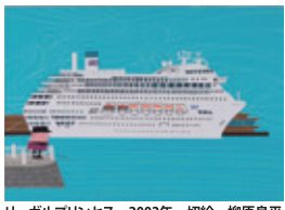
リーガルプリンセス 2002年 切絵 柳原良平

開館1周年を迎えた柳原良平アートミュージアムで、氏が好きだった客船や乗船した客船を描いた作品を集めた展示。「絵に描きたくなる船」と言われた作品は、船と海へのロマンがいっぱいだ。