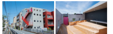
(左)屋上広場が整備された赤い色の屋上階段が特徴的な建物 (右)木製デッキのステージを備えた「そらとやねの広場」

整備では、地域住民等と木製デッキを作るワークショップを行いました。完成後は、1階のパン屋の開店時間に合わせて屋上を地域に開放しています。FM上星川の代表は、「整備をしたことで、あの場所がまちの核になってきた。昔の商店街や地域にあった、心の温かさが伝わる距離を取り戻したい」とおっしゃいます。FM上星川の活動から今後も目が離せません。