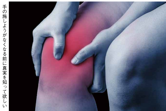
手の施しようがなくなる前に真実を知って欲しい